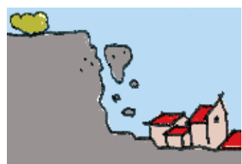
Le risque majeur